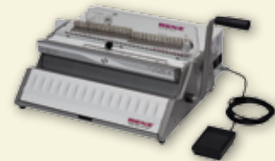
SRW 360 comfort / eco 360 comfort

In nur 3 Minuten vom manuellen zum elektrischen Stanz- und Handbindegerät umgebaut.