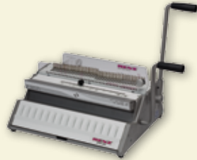
SRW 360 / eco S 360

In nur 3 Minuten vom manuellen zum elektrischen Stanz- und Handbindegerät !