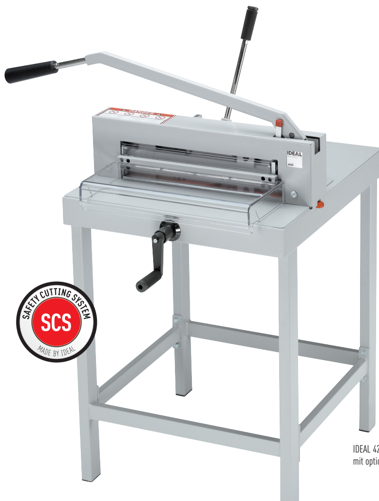
IDEAL 4205 mit optionalem Untergestell