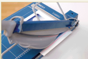
Präzise Laserstrahl- Schnittan- deutung.